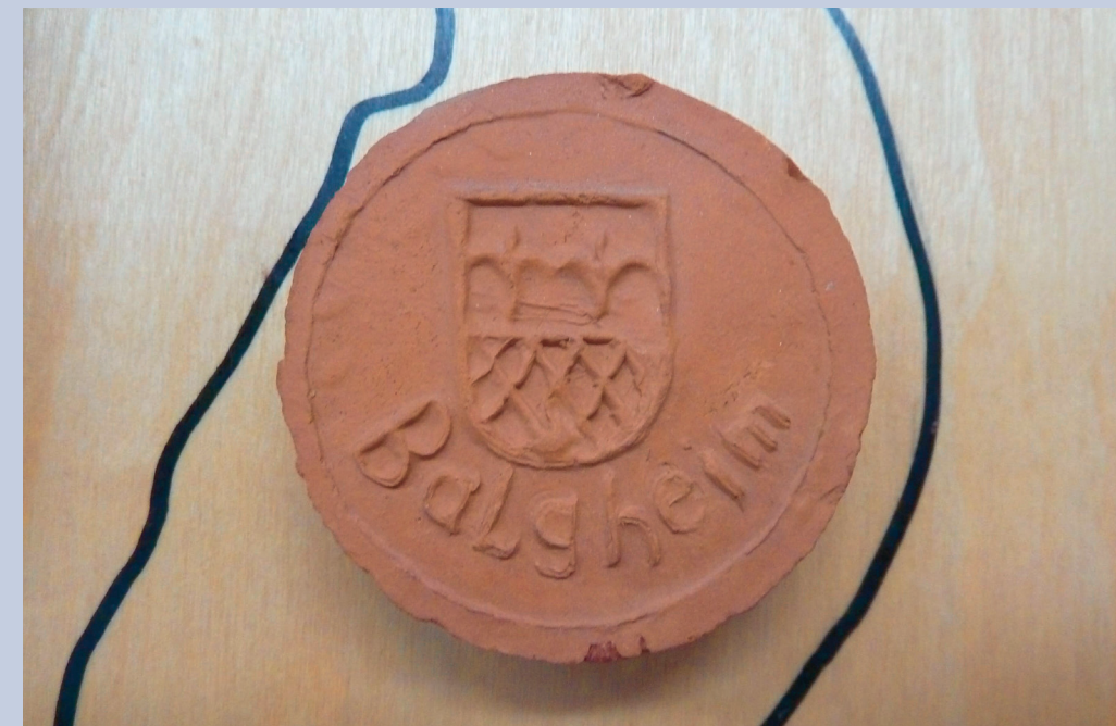
Marksteinzeuge von Balgheim mit dem Gemeindewappen